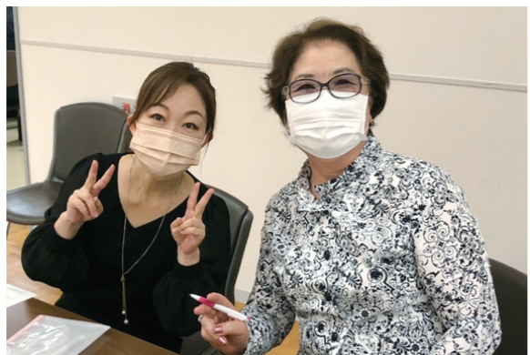
引き続き米山の寄付をお願いします。